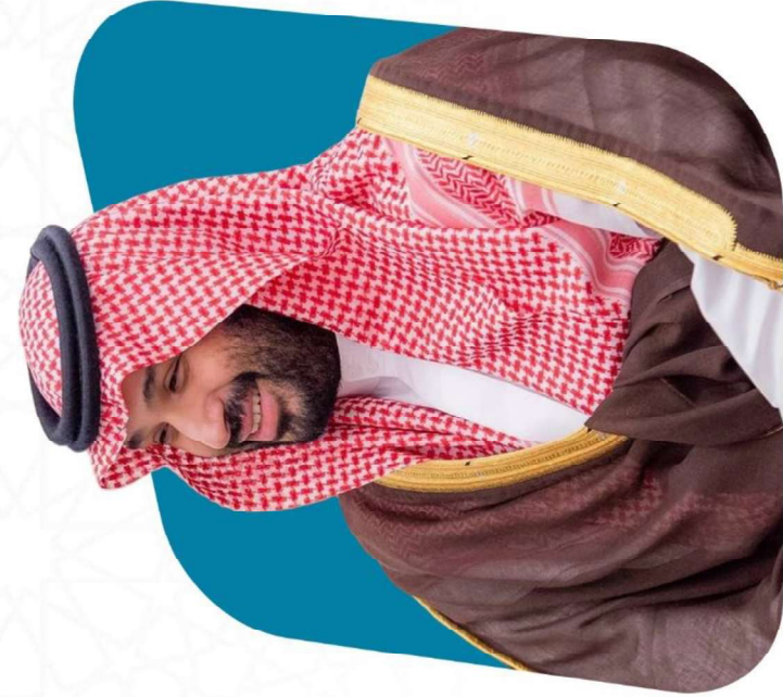
صاحب السمو الملكي الأمير محمد بن سلمان بن عبدالعزيز آل سعود ولي العهد رئيس مجلس الوزراء وزير الدفاع