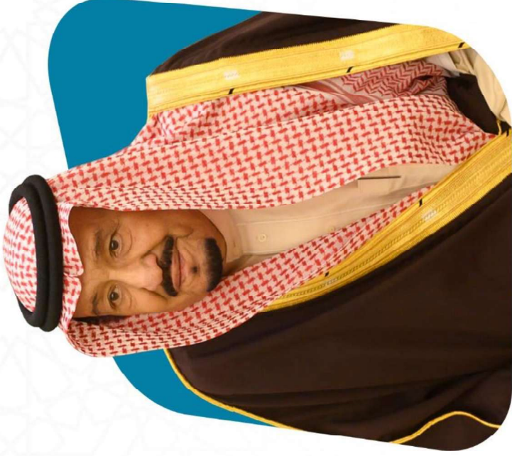
خادم الحرمين الشريفين الملك عبدالعزيز آل سعود